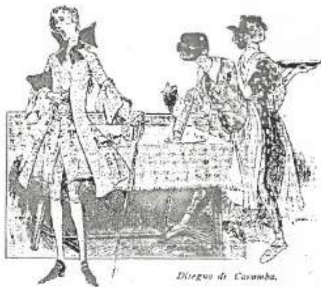
Disegno di Cavamba.