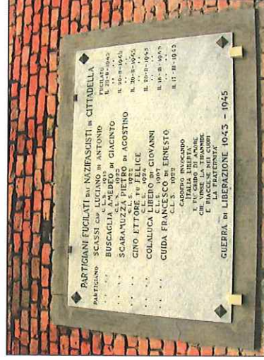
◦ Alessandria: Ai Martiri della Cittadella.