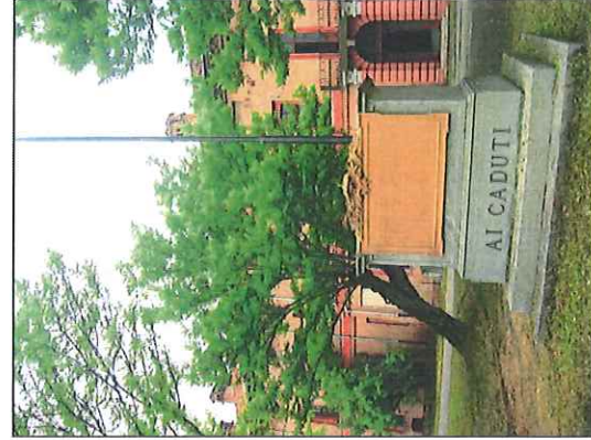
◦ Alessandria: Monumento e lapidi alla Caserma Bellerio.