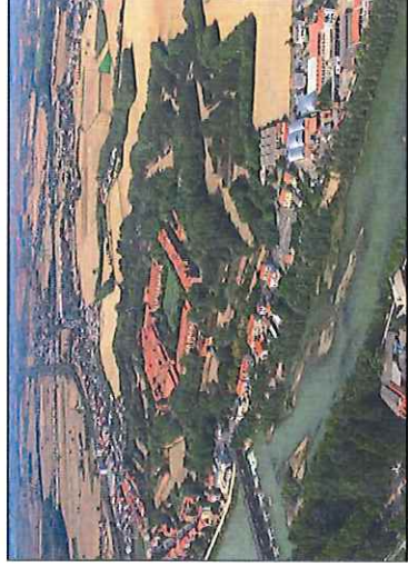
◦ Alessandria: La Cittadella ed il Tanaro. Foto di Gianni Giansanti "La Provincia Vo' Cercando", Ed. Mazzotta (Mi), 2000.