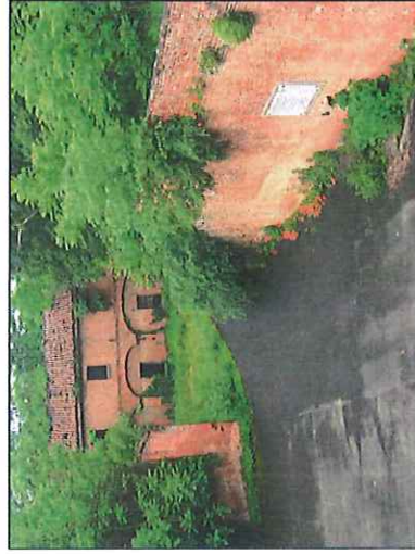
◦ Alessandria: Lapide partigiana dell'eccidio della Cittadella.

🚗 Come si raggiunge: In auto da Torino: Autostrada A21 - Uscita Alessandria Ovest. Da Milano A7/A21 - Uscita Alessandria Est. Da Genova: Autostrada A26 - Uscita Alessandria Sud.