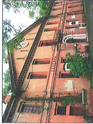
◦ Alessandria: Monumento e lapidi ai fanti del 37° Reggimento "Ravenna".