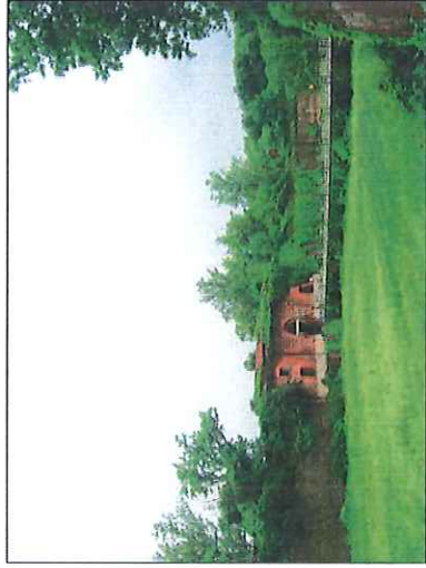
◦ Alessandria: I bastioni della Cittadella e la porta carraia.